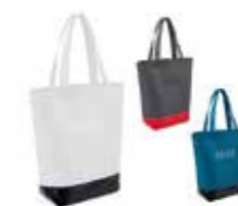
SAC SHOPPING MINI COULEUR BLOCK

Blanc/noir, gris/corail, Island/noir 80 22 2445671, 80 22 2460863-64 45 × 25 × 27 cm