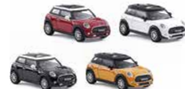
MINIATURE MINI HATCH (F56)

Plastique Boîte de 24 pièces en trois couleurs (Chili Red, Electric Blue, Volcanic Orange) 80 44 2447939 Taille : 1:36