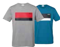
T-SHIRT HOMME MONOGRAMME MINI