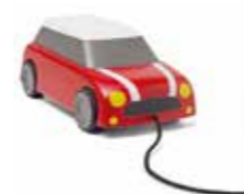
VOITURE EN BOIS À TIRER

Hêtre certifié FSC Rouge 80 45 2460912 16 x 9 x 7 cm