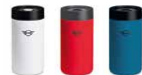
MUG DE VOYAGE MINI

Blanc/noir, Island/noir 80 26 2460917-18 Cadran : 38 mm