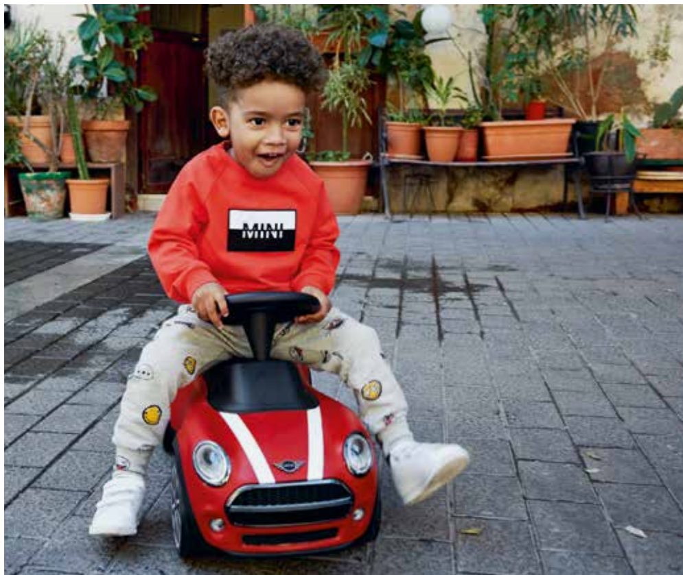
Photo de gauche : Baby Racer, sweat-shirt enfant avec application logo MINI Photo de droite : Voiture en bois à tirer