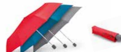
PARAPLUIE PLIANT MINI SIGNET

Gris, corail, Island 80 27 2460886-88 480 x 12 x 12 cm