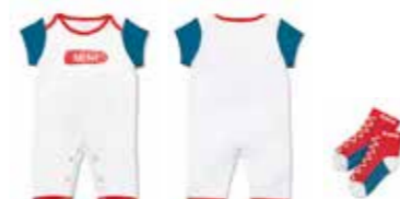
ENSEMBLE POUR BÉBÉ MINI

98 % coton, 2 % viscose Multicolore 80 45 2445714 10 x 7 cm