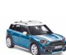
MINIATURE MINI COUNTRYMAN (F60)

Moulage sous pression Pepper White, Chili Red, Electric Blue 80 43 2405582 - 84 Taille : 1:18