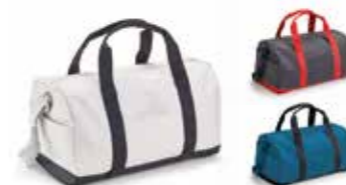
SAC DE SPORT MINI COULEUR BLOCK

Gris, corail, Island 80 21 2460868-70 8,5 × 8,5 × 0,4 cm