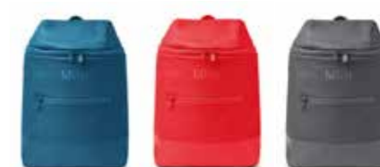
SAC À DOS MINI COULEUR BLOCK

Blanc/noir, gris/corail, Island/noir 80 21 2460853-55 15 × 2 × 15 cm