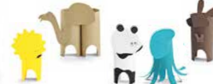
KIT DE BRICOLAGE ANIMAUX ENFANTS MINI

Papier : certifiés FSC Multicolore 80 45 2460914 A5