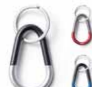
PORTE-CLÈS MINI COLOUR BLOCK