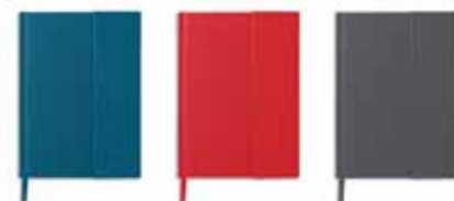
CARNET DE NOTES RELIÉ EN TOILE MINI

Papier : certifié FSC, fermeture magnétique