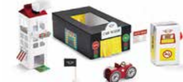
KIT DE BRICOLAGE AUTO ENFANTS MINI

Carton Multicolore 80 45 2445730 23 x 32,5 cm