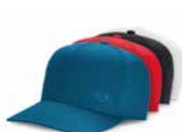
CASQUETTE MINI SIGNET