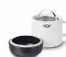
INFUSEUR À THÉ MINI

Blanc/noir 80 23 2445715 Contenance : 0,8 l