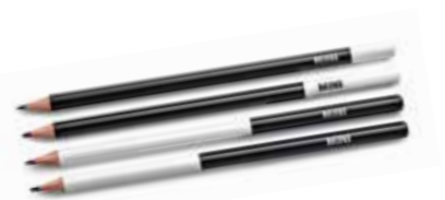
JEU DE CRAYONS MINI

Island, corail, gris 80 24 2460897-95 21,6 x 15,7 x 1,9 cm