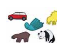
LOT DE PATCHS THER- MOCOLLANTS MINI

Carton, autocollants, attaches parisiennes Multicolore 80 45 2445729 23 x 32,5 cm