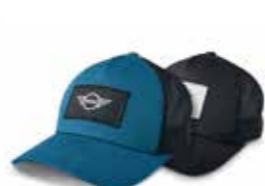
CASQUETTE AVEC APPLICATION LOGO MINI

Island, Corail, noir, blanc 80 16 2460850-49 80 16 2445652-51