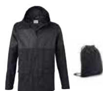
VESTE HOMME MINI AVEC SAC À DOS

Gris S-XXXL 80 14 2460806-11 Island S-XXXL 80 14 2460812-17