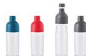
BOUTEILLE D'EAU MINI COLOUR BLOCK

Multicolore 80 45 2460915 33 x 8 x 20,5 cm