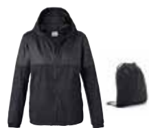
VESTE FEMME MINI AVEC SAC À DOS

Corail XXS-XL 80 14 2454945-50 Island XXS-XL 80 14 2454951-56