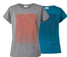
T-SHIRT FEMME MINI SIGNET

Noir/blanc/Island XXS-XL 80 14 2454915-20 Gris/corail/blanc XXS-XL 80 14 2454921-26