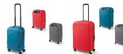
VALISE TROLLEY CABINE MINI

PORTEFEUILLE 80 21 2460871 13,5 × 1 × 9,5 cm POCHETTE 80 21 2460872 22 × 9 × 15 cm