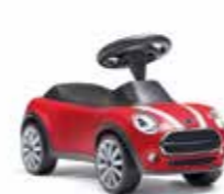
BABY RACER MINI

Acier Chili Red 80 93 2451012 23 x 40 x 62 cm