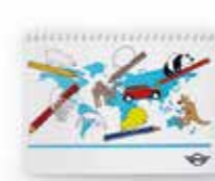
LIVRE DE COLORIAGE MINI

Papier : Certifié FSC Crayons de couleur : certifiés FSC Multicolore 80 45 2445712 3 feuilles A4, Crayons de couleur 9 x 1,6 x 1,6 cm