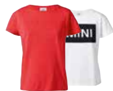
T-SHIRT FEMME MONOGRAMME MINI