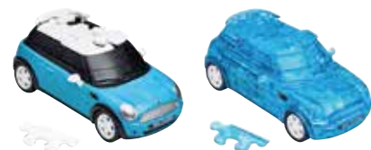
MINI HATCH COOPER S EN PUZZLE

Plateau : polypropylène Roues : polypropylène Noir/rouge/blanc 80 23 2460916 57 x 15,3 x 13 cm