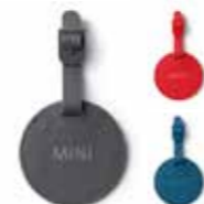
ÉTIQUETTE POUR BAGAGES