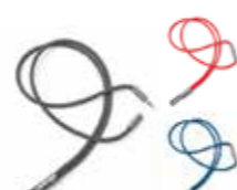
LANIÈRE MINI TUBE

Noir/argent, noir/Island, gris/corail 80 27 2460882-84 60 x 38 x 5,5 cm