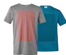
T-SHIRT HOMME SIGNET MINI

Noir/blanc S-XXXL 80 14 2460776-81 Blanc/noir S-XXXL 80 14 2460782-87