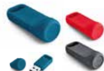
CLÉ USB MINI