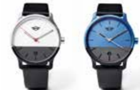
MONTRE MINI COLOUR BLOCK

Argent/noir 80 24 2460900 130 x 11,5 x 11,5 mm