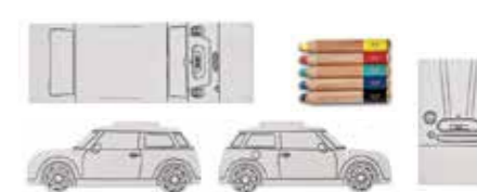
JEU DE COLORIAGE MINI

Papier : Certifié FSC Crayons de couleur : certifiés FSC Multicolore 80 45 2445712 3 feuilles A4, Crayons de couleur 9 x 1,6 x 1,6 cm