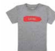
T-SHIRT ENFANT MONOGRAMME MINI

100 % coton Blanc/Island/corail, Taille (6-9 mois) 80 14 2460848