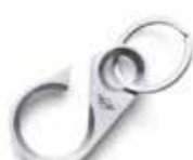
PORTE-CLÈS OUVRE-BOUTEILLE MINI

Argent/noir 80 27 2445686 190 x 18 x 7 cm