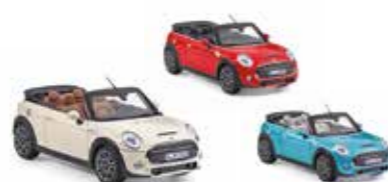
MINIATURE MINI CABRIO (F57)

Moulage sous pression Blazing Red, Midnight Black, Volcanic Orange 80 43 2413799, 80 43 2339558, 80 43 2413800 Taille : 1:18