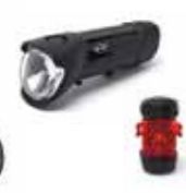
FEUX DE VÉLO MINI

Aluminium, inox Gris foncé 80 91 2413798* Dimensions : 150 x 110 x 60 cm Dimensions (plié) : 85 x 65 x 30 cm