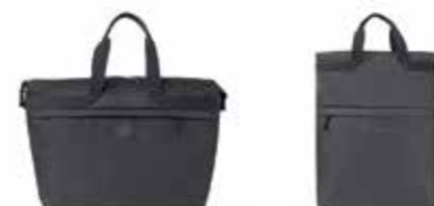
SÉRIE MINI TON SUR TON

Island, corail, gris 80 22 2460867-65 23 × 16 × 35 cm