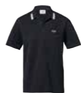
POLO HOMME AVEC APPLICATION LOGO MINI

Gris/Corail S-XXXL 80 14 2460788-93 Island/noir S-XXXL 80 14 2460794-99