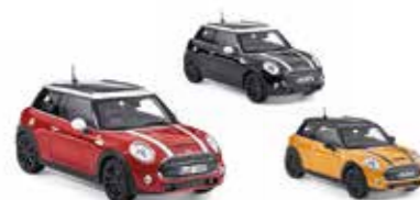
MINIATURE MINI COOPER S (F56)

Moulage sous pression, plastique Boîte de 36 pièces en quatre couleurs (Volcanic Orange, Midnight Black, Pepper White) 80 42 2339551 Taille : 1:64