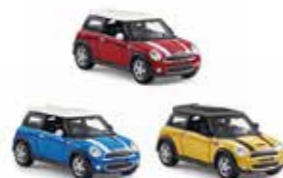
MINI COOPER S A FRICTION

Plastique Bleu laqué, bleu transparent 80 44 2406541 - 42 Taille : 1:32