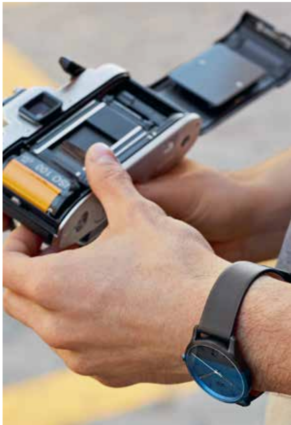
Photo de gauche : Montre Colour Block Photo de droite : Parapluie canne MINI signet, Sweat-shirt homme avec application logo MINI