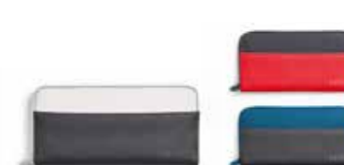
PORTEFEUILLE MINI COULEUR BLOCK

Blanc/noir, gris/corail, Island/noir 80 22 2445667, 80 22 2460861-62 40 × 40 × 14 cm