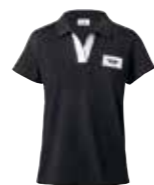
POLO FEMME AVEC APPLICATION LOGO MINI

Gris/corail XXS-XL 80 14 2454927-32 Island/noir XXS-XL 80 14 2454933-38