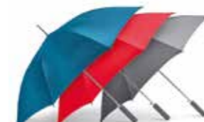
PARAPLUIE CANNE MINI SIGNET

Corail, Island, gris 80 23 2460889-90, 80 23 2445719 Fermé : 27 x 6 cm Diamètre : 98 cm