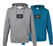
SWEAT-SHIRT HOMME AVEC APPLICATION LOGO MINI