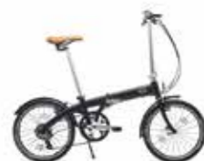
VÉLO PLIABLE MINI

Aluminium, inox Gris foncé 80 91 2413798* Dimensions : 150 x 110 x 60 cm Dimensions (plié) : 85 x 65 x 30 cm