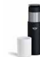
THERMOS DE VOYAGE MINI

Blanc/noir, corail/gris, Island/noir 80 28 2445702, 80 28 2460909-10 Contenance : 0,3 l