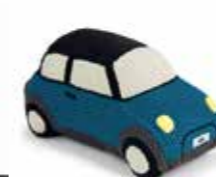
VOITURE MINI EN TRICOT

Hêtre certifié FSC Rouge 80 45 2460912 16 x 9 x 7 cm