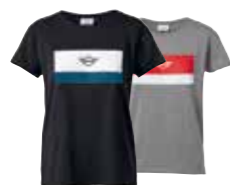
T-SHIRT FEMME LOGO MINI

Corail XXS-XL 80 14 2454903-08 Blanc/noir XXS-XL 80 14 2454909-14