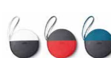
POCHETTE RONDE MINI COULEUR BLOCK

Blanc/noir, gris/corail, Island/noir 80 21 2460858-60 35 × 2 × 26 cm