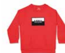
SWEAT-SHIRT ENFANT AVEC APPLICATION LOGO MINI

100 % coton Corail 98-128 80 14 2460836-41