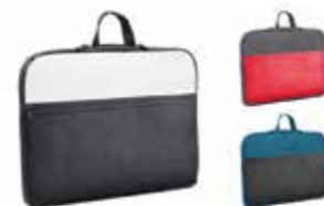
POCHETTE POUR ORDINATEUR PORTABLE MINI COULEUR BLOCK

Blanc/noir, gris/corail, Island/noir 80 21 2445661, 80 21 2460856-57 19 × 2 × 10 cm