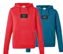
SWEAT-SHIRT FEMME AVEC APPLICATION LOGO MINI