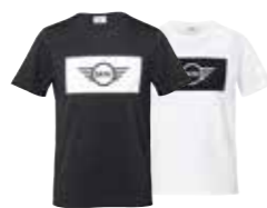
T-SHIRT HOMME LOGO MINI

Gris/Corail/noir S-XXXL 80 14 2454963-69 Island/noir/blanc S-XXXL 80 14 2460770-75